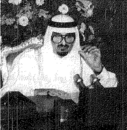
بإذنه المناسبة الكريمة يسرني ان اعرب لكل احبتموني به من صادق محبتكم ووفائكم ومشاعركم المخلصة وهذا يدل على وحدة القلوب وروابط المحبة التي تجمع بيننا حتى اصبحنا في هذا البلد أسرة واحدة متماسكة لا فرق بين حاكم وعام..

كما اتوجه بالشكر الجزيل الى جميع قادة الامم الاسلامية والعربية الذين اصبروا لنا عن صادق مشاعر الاخوة والمودة واسأله تعالى ان يحفظ الجميع من كل سوء ومكروه. في الختام ارجو الله سبحانه وتعالى ان يفتح لنا فطرنا بسلامة وبصحة والعافية كما انعمه الله جل جلاله وان يحفظ بلادنا العزيزة ويديم عليها عزها وامنها واستقرارها وان يوفقنا الى كل ما نريده اليه في القول والعمل وان يعيد هذه الايام المباركة على المسلمين في كل مكان وقد اتواكم كلمتهم على الحق والهدى ودين الله القويم ليكونوا خير امة اخرجت للناس. والسلام عليكم ورحمة الله وبركاته.. عكاظ - واس - جدة: هذا خادم الحرمين الشريفين الملك فهد بن عبدالعزيز الامتين العربية والإسلامية والشعب السعودي بعيد الفطر المبارك، واتى حقله الله - في كلمة متفردة - على بلادنا، مبررا راحة الله عن اعزازهم بمشاعر الجميع الصادقة تجاه العارض المصني الذي تعرض له مؤخرًا. وبقيا على تمن الكلمة التي القاها حقله الله بصوته عبر الاذاعة والتلفزيون منذ ايام: الحمد لله رب العالمين والصلوة والسلام على رسولنا ونبينا محمد وعلى آله وصحبه اجمعين. السلام عليكم ورحمة الله وبركاته.. من جانب بيت الله الحرام ومهجد الوحي ومنتج نور الاسلام طيب في وحين يستقبل عيد الفطر السعيد - بعد ان من الله علينا بتمام شهر الصوم المبارك واعاننا على صياحه وقيامه ان يتوجه اليكم وإلى جميع اخواننا المسلمين من الزوار والمعتمرين وإلى كل شعوب الامم الاسلامية في مشارق الارض ومغاربها بامتياز التهنئة بهذه المناسبة الخالدة شاكرا لله عز وجل ان يتقبل منا ومنكم صالح الاعمال. لها الاخوة المواطنين