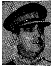
سفير باكستان لدى المملكة العربية السعودية