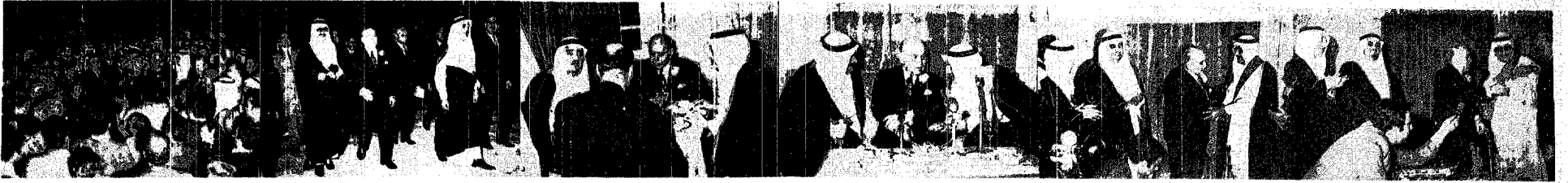
لقطات من حفل سعادة سفير لبنان لدى المملكة الذي اقامه على شرف دولة الرئيس صاحب سلام وقد دعى الى العشاء صاحب السمو الملكي الامير فهد بن عبدالعزيز وصاحب السمو الملكي الامير فيصل بن عبدالعزيز وممسال السيد عمر السفاح .. وعدد كبير من الامراء، الوزراء والمسؤولين .. وفي هذا الحفل قدم دولة الرئيس صاحب سلام رئيس وزراء لبنان سمو الامير فهد بن عبدالعزيز امير منطقة مكة وشاح الارز اللبناني