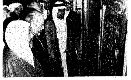
لقطات من زيارة دولة الرئيس صاحب سلام لمدينة الثور وبشاهد صاحب السمو الملكي الامير عبدالمحسن بن عبدالعزيز في استقبال دولة الضيف في مطار المدينة .. ودولته وهو يسؤدى الصلاة في المسجد النبوي .. ثم وهو يقف امام قبر الرسول عليه افضل الصلوات والسلام ..