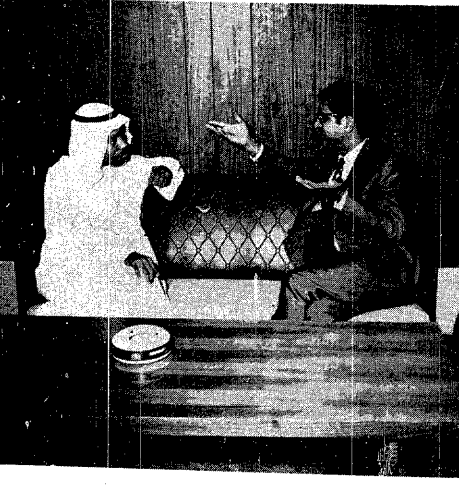
* انت « عكاف » بزيارة قام بها سعادة مستشار السفارة الباكستانية بجدة يرافقه احد موظفي السفارة . وقد تحدث سعادته مع أسرة التحرير عن العلاقات الاخوية التي تربط بين المملكة العربية السعودية والباكستان وشاد بنو هذه الروابط الاسلامية بين البلدين المسلمين .

ضارب العود .. هنزا للصبيا الحلو .. دافقا للعتي .. وما عتني للزمان الذي انقضى .. واهب العمر ما وهب .. بعض ما فات .. ما ذهب .. قد صحا اليوم .. قد وثب .. يسأل الصب رجما .. لليبالي .. وما انتهت .. تحن للفن .. من زما لن .. نارتنا فيه .. جنسة قارق بالعود همسة .. وانسكب الهمس نغمة .. يشئني العود .. يستوي .. ليس من دايها الصخب .. يا معبرا شباينا .. فمسة .. شايها ذهب .. دع لمن عد ما حسب .. اشترق الحب .. ما غرب .. ان تركناه .. من لهم .. وبالمناحية .. ولهدم اغفال الاشارة للاساق .. بعد اللحق ..