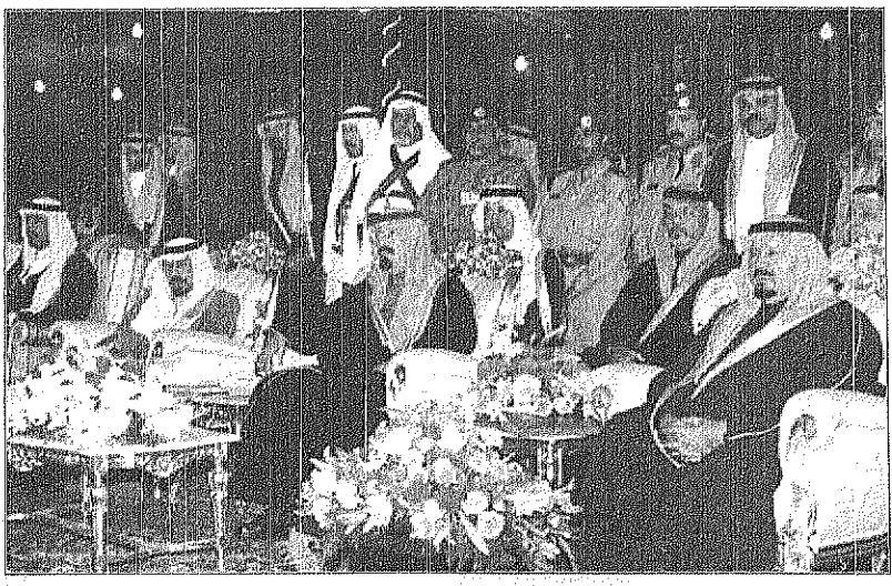
سمو ولي العهد لدى افتتاحه أحد المعجزات الوطنية

إبناء القبائل معبرين عن فرحتهم بقدم سمو ولي العهد: