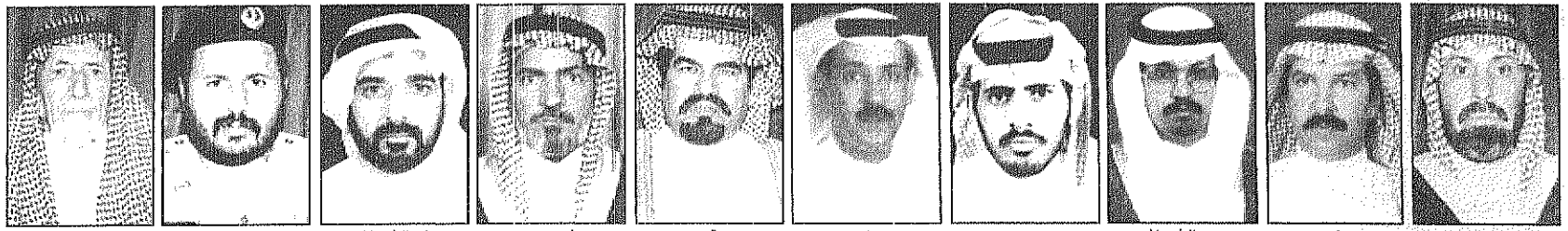
عبدالله ال قهشة - بيشة: برحبون بسمو ولي العهد في زيارته الميمونة لمحافظه بيشة.

(*) مساعد مدير الشؤون الصحية للرعاية الأولية - بيشة