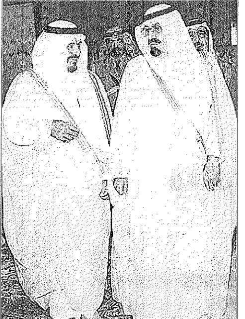
سمو ولي العهد لدى مغارته جده وسمو النائب الثاني يودعه

سموه يصل دمشق والرئيس الأسد يستقبله بالمطار