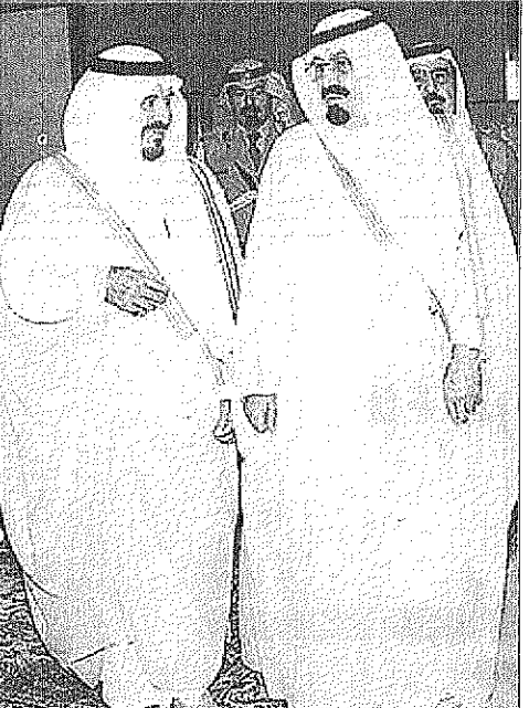
سمو ولي العهد لدى مغارته جده وسمو النائب الثاني يودعه

وإعضاء سفارة المملكة العربية السعودية في سوريا وعدد من أفراد الجالية السعودية المقيمة في سوريا. وعند مدخل صالة التشریفات بالمطار استقبل فخامة الرئيس حافظ الأسد رئيس الجمهورية العربية السورية الشقيقة أخاه صاحب السمو الملكي الأمير عبدالله بن عبدالعزيز حيث عانقه وفخامته مرحبا به في بلده الثاني سوريا. ويعد استراحة قصيرة في المطار صبح فخامة الرئيس حافظ الأسد أخاه صاحب السمو الملكي الأمير عبدالله بن عبدالعزيز في موكب رسمي إلى قصر تشرين المقر المجد لإقامة سموه. ويرافق سمو ولي العهد وصاحب السمو الملكي الأمير سعود الفيصل وزير الخارجية وصاحب السمو الملكي الأمير محمد بن عبدالله بن عبدالعزيز المستشار بديوان سمو ولي العهد وصاحب السمو الملكي الأمير سعود الفيصل وزير الدولة عضو مجلس الوزراء ومعالى رئيس ديوان سمو ولي العهد ناصر الراحمي ومستشاري سمو ولي العهد محمد بن عبدالرحمن آل الشيخ ومعالى المستشار بديوان سمو ولي العهد