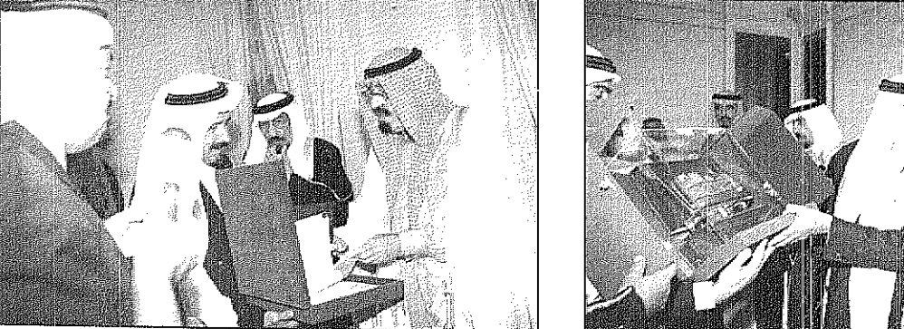
سمو ولي العهد يتلقى هدية من أسرة آل مشيط

على جاشي الطريق لمحطة سموه الكريم، وتأتي زيارة سمو ولي العهد لهاتين الاسرتين في اطار التواصل المتشدد ما بين ولاه الامم ومواطنيهم المتخصصين في كافة مناطق المملكة الجنوبية وهي استناد لمشروع الامم منذ عهد عبدالعزیز وامتانه الابن.