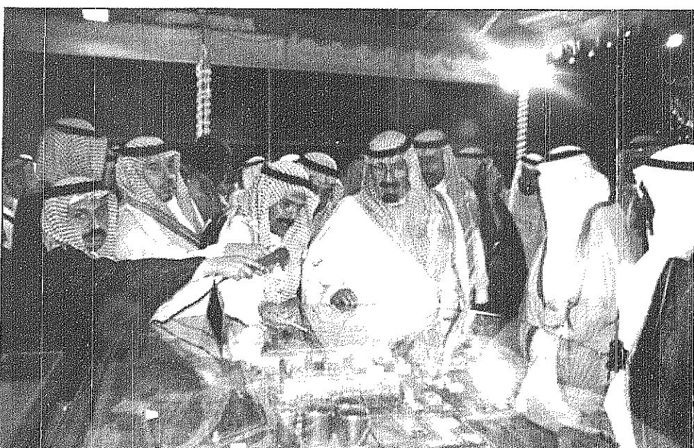
سمو ولي العهد يستمع الى شرح حول مشروع محطة الطاقة