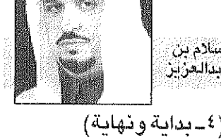
السيد سيدنا محمد بن عبد العزيز