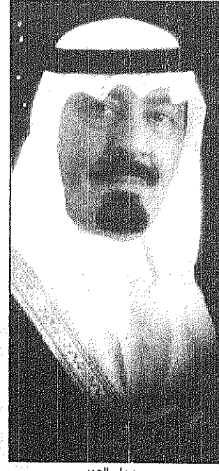
سمو ولي العهد

رحب بولة رئيس الحكومة الاردنية عبدالسلام المجالي بالزيارة الرسمية التي سيلقونها بها صاحب السمو الملكي الامير عبدالله بن عبدالعزيز ولي العهد ورئيس مجلس الوزراء ورئيس الحرس الوطني الى عمان يوم غد. وقال نولته في اتصال هاتفي اجرته معه «عكافه» ظهر امس اننا في منتبهي السعداء ان مستقبل في الاردن سمو الامير عبدالله بن عبدالعزيز... ولاشك ان هذه الزيارة قديبل على عمق العلاقات والمحببة والتنسيق والتشاور ما بين المملكة العربية السعودية والمملكة الاردنية الهاشمية.. هذه العلاقة التي نعتز بان نرسى قواعدهما خادما