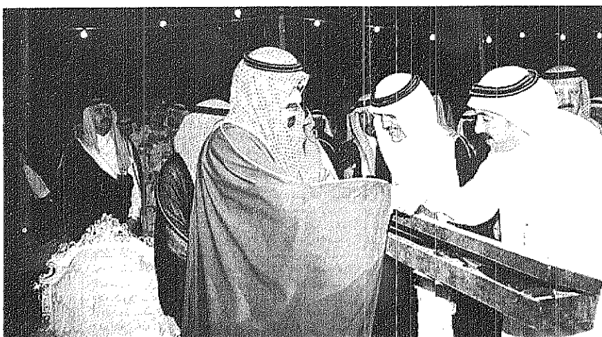
سمو ولي العهد يتسلم هدية من شيخ قبائل لحاف والوثشة وال الجبل