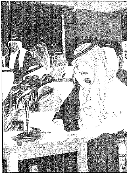
سمو ولي العهد يلقي كلمته في حفل أمالي عسير