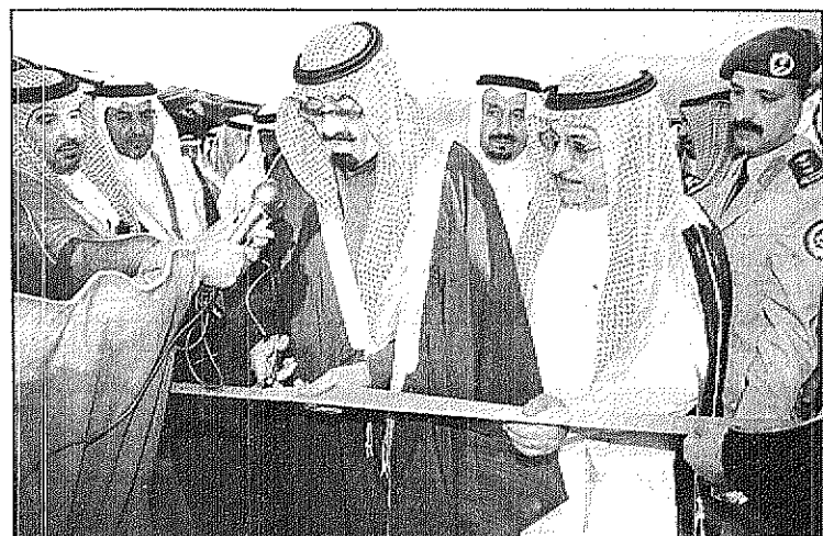
سمو ولي العهد يفتتح معرض الطرق لمنطقة عسير

عكاظ (جدة) الزيارة الميمونة التي يقوم بها صاحب السمو الملكي الأمير عبدالله بن عبدالعزيز ولي العهد ونائب رئيس مجلس الوزراء ورئيس الحرس الوطني لمنطقة عسير حالياً تأتي في إطار الاهتمام الكبير الذي توليه حكومتنا الرشيدة بقيادة خادم الحرمين الشريفين الملك فهد بن عبدالعزيز وسمو ولي عهده الأمين لكل ما من شأنه راحة المواطن ورفاهيته.