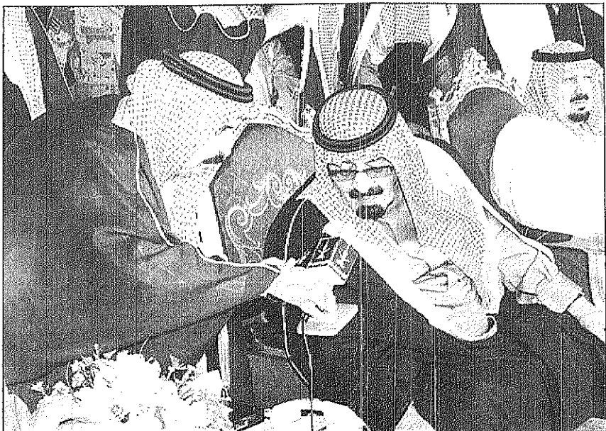
سمو ولي العهد يفتتح مشروع تحلية المياه بمنطقة عسير