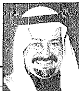
سماحة الملك فهد بن عبدالعزيز بن مقرن

يعتقد الإنسان في حياته اليومية على الماء، ويعتقد الصخر على الاطراف بعد الله في توفير مياه الشرب والري وكانت مشكلة الإنسان مع الأمطار تكمن في شحها وتفاوتها كونها تفرح في بضعة أشهر من السنة وتغييب في شهور أخرى كثيرة مما يجعل الاستفادة منها محدودة جداً بما يقع الإنسان للبحث عن وسيلة تمكنه من الاحتفاظ بهذه المياه للاستفادة منها أطول وقت ممكن. لهذا إلى استخدام الحواجز الصخرية في الشعاب والوديان.