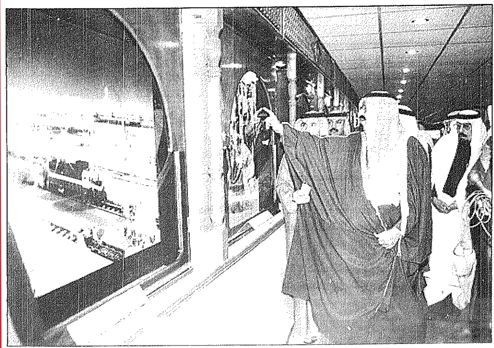
سمو ولي العهد يتطلع على محتويات معرض الدقيق لعسير