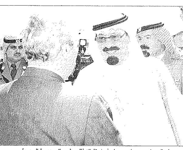
سمو ولي العهد لدى وصوله سوريا وفي استقباله نائب رئيس الجمهورية السورية