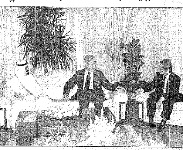
سمو ولي العهد يجتمع مع الرئيس السوري

ندعو العالم والولايات المتحدة الصديقة للتوقف مع الحل العادل وادفع السلام قداما نحذر اسرائيل من التهور وندعوها للقبول بالحقائق الثابتة والحقوق الرئيس السوري عقد معه جلستي عمل وكرمه الامير عبدالله يستعرض مع الاسد العلاقات ويجمل الأحداث الراهنه