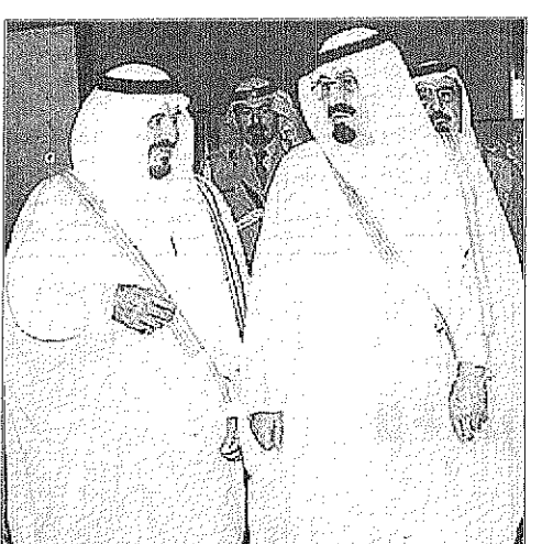
سمو ولي العهد ليلى ومغاريته جده وسمو النائب الثاني يودعه