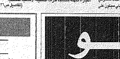
ناصر الطغلي هاتقيا للثمن

قرب كبير من الاستفادة الفورية المرجوة لعناصر الأخضر وبمبادرة البروفة البيئية التي تقيمها اللجنة الوطنية للأخضر لغرض غرس ما يزيد على مليون شجرة، وقيل سيعمل في حديقته كغذاء غير البائس، ان شاء الله. تأتي زيارة سمو ولي العهد في وقت تشهد فيه المنطقة العربية تحديات كبيرة، وتعد خطوة مهمة في مسيرة العمل العربي المشترك، وتعد رسالة قوية للتضامن العربي المنشود.