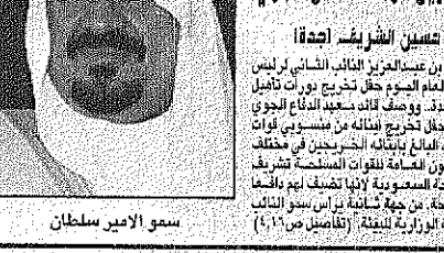
سمو الامير سلطان

ترأس صاحب السمو الملكي الامير سلطان بن عبدالعزيز آل سعود وزير الدفاع والطيران والمفتش العام جلسة مجلس الوزراء برئاسة سمو ولي العهد في عمان، وتناولت الجلسة قضايا البيئة والتنمية المستدامة. تأتي زيارة سمو ولي العهد في وقت تشهد فيه المنطقة العربية تحديات كبيرة، وتعد خطوة مهمة في مسيرة العمل العربي المشترك، وتعد رسالة قوية للتضامن العربي المنشود.