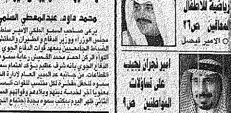
سمو الامير سلطان

ترأس صاحب السمو الملكي الامير سلطان بن عبدالعزيز آل سعود وزير الدفاع والطيران والمفتش العام جلسة مجلس الوزراء برئاسة سمو ولي العهد في عمان، وتناولت الجلسة قضايا البيئة والتنمية المستدامة. تأتي زيارة سمو ولي العهد في وقت تشهد فيه المنطقة العربية تحديات كبيرة، وتعد خطوة مهمة في مسيرة العمل العربي المشترك، وتعد رسالة قوية للتضامن العربي المنشود.