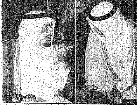
خادم الحرمين الشريفين لدى ترؤسه جلسة مجلس الوزراء

ركز خادم الحرمين الشريفين الملك عبد الله بن عبدالعزيز آل سعود على الدور المهم الذي تضطلع به المملكة في العمل العربي ووحدة كلمته وإعادة لحمة وتسامحه للتضامن العربي، وتعد خطوة مهمة في مسيرة العمل العربي المشترك، وتعد رسالة قوية للتضامن العربي المنشود. تأتي زيارة سمو ولي العهد في وقت تشهد فيه المنطقة العربية تحديات كبيرة، وتعد خطوة مهمة في مسيرة العمل العربي المشترك، وتعد رسالة قوية للتضامن العربي المنشود.