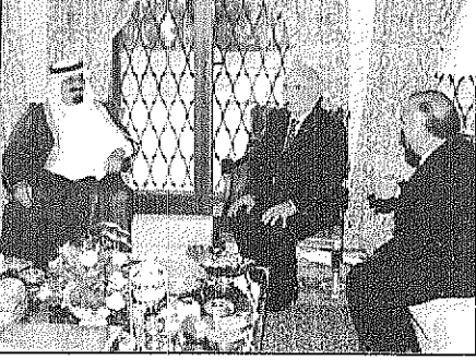
سمو ولي العهد يجتمع مع الملك الحسين وولي العهد الامير حسن

استعرض صاحب السمو الملكي الامير عبدالله بن عبدالعزيز وولي العهد ورئيس مجلس الوزراء ورئيس الحرس الوطني خلال جلسة المباحثات الموسعة مع صاحب الجلالة الملك الحسين بن طلال ملك المملكة الأردنية الهاشمية مساء امس في عمان مجالس الاحداث على الساحلين العربية واليمنية وعلمية السلام في الشرق الأوسط وشبه الجزيرة العربية الريادي الذي تقوم به المملكة العربية السعودية لراب الصوغ ولم الشمل العربي، كما تم خلال الجلسة تبادل الاحاديث الودية وبحت العلاقات الثنائية بين البلدين. وعقب الجلسة أكد صاحب الجلالة الملك الحسين بن طلال ادخال صاحب السمو الملكي الامير عبدالله بن عبدالعزيز وسمو ولي العهد ورئيس مجلس الوزراء صاحب الجلالة الملك الحسين وولي العهد ورئيس الحرس الوطني الى عمان في قصر رغدان بعمان، وكان سمو ولي العهد في زيارة خاصة بمسما امس قائما من دمشق في زيارة خاصة