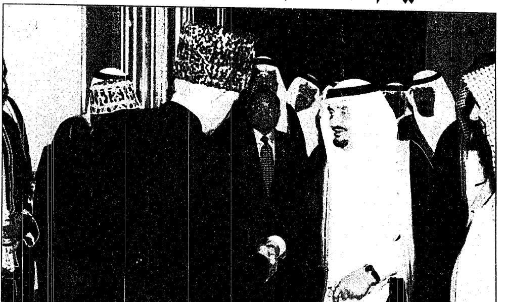
خادم الحرمين الشريفين وسمو ولي العهد أثناء الحفل السنوي ببنى يوم امس