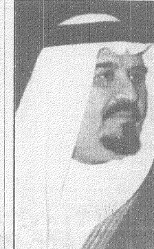
سمو الامير سلطان

محمد الغامدي- الرياض يرعى صاحب السمو الملكي الامير سلطان بن عبدالعزيز نائب الرئيس عبدالعزیز بن عبدالعزيز وزير الداخلية الرئيس الفخري لمجلس نواب المسجونين والارامل والنساء في تصريح صحفي عقب وصوله أمس إلى تونس.