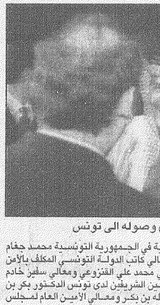
الامير نايف لادى وصوله الى تونس

عبدالله العريفي، واس - تونس أكد صاحب السمو الملكي الامير نايف بن عبدالعزيز وزير الداخلية الرئيس الفخري لمجلس نواب المسجونين والارامل والنساء في تصريح صحفي عقب وصوله أمس إلى تونس.