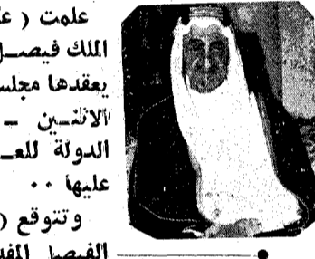
الكويت وموريتانيا تؤيدان الكفاح الفلسطيني

علمت (عكاظ) ان حضرة صاحب الجلالة الملك فيصل المعظم سيترأس جلسة هامة يعقدها مجلس الوزراء امس هذا اليوم الاثنين - وذلك لمناقشة ميزانية الدولة للعام المالي ٩٠-٩١ والمصادقة عليها . وتتوقع (عكاظ) ان يوجه جلاله الفيصل المفدى كلمة سامية بهذه المناسبة كعادة جلالته في كل عام .