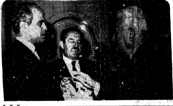
سمو الامير فواز يتفقد السجن العمومي بجدة - ص ٨

القدس - اجتمعت الوزارة الاسرائيلية هنا امس لاعطاء تعليمات نهائية الى جوزيف تكواه ممثل اسرائيل المناوب الى محادثات السلام للشرق الاوسط في نيويورك وقال مراقبون هنا ان الحكومة ستزود تكواه بقائمة اسئلة التي الدكتور غونار بارنج مبعوث السلام الدولي لتلقيها الى مصر والاردن وقال المراقبون ان اسرائيل تريد ان تعرف منذ البداية نسوج السلام الذي تريده مصر والاردن في غمرة ازدياد اللقح هنا حول ما ذكر من استمرار مصر في خرق وقف اطلاق النار ويتوقع ان يعود تكواه للشرق الاوسط في اليوم لاستئناف الاتصالات وكان قد استدعي الى بلادها لاجراء مشاورات في اليوم الاول من محادثات بارنج في الاسبوع الماضي وعقدت جولدا مائير رئيسة وزراء العدو الاسرائيلي اجتماعين امس مع الجنرال موسى دايان وزير دفاع العدو اثر خلافات بينه وبين اقلية الوزراء حول الموقف الذي يجب اتخاذه هذا وقالت مجلة «التايم» الاميركية امس ان موسى دايان وزير الدفاع الاسرائيلي ينظر في موضوع استقالته من حكومة جولدا مائير رئيسة الوزراء