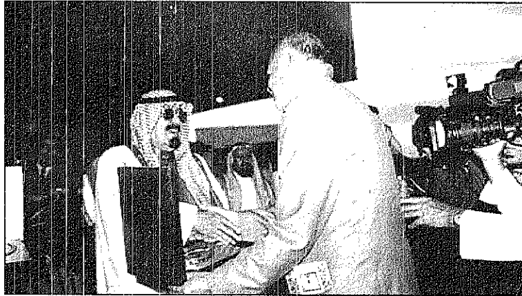
سمو يسلم درج نادي الفروسية لاحد الضيوف