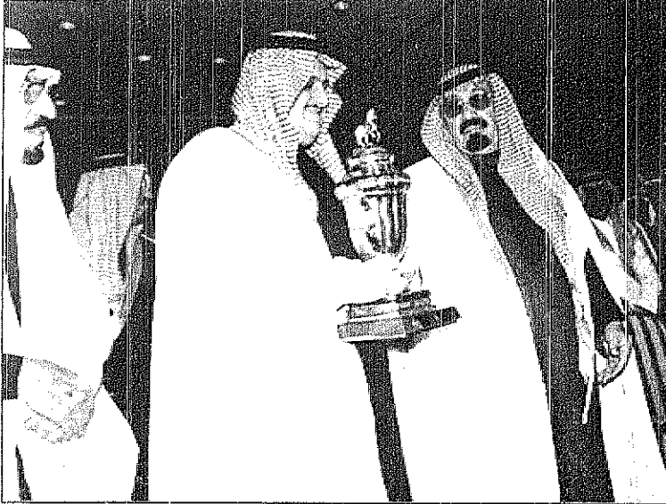
سمو يسلم الكاس للامير سلطان بن تركي