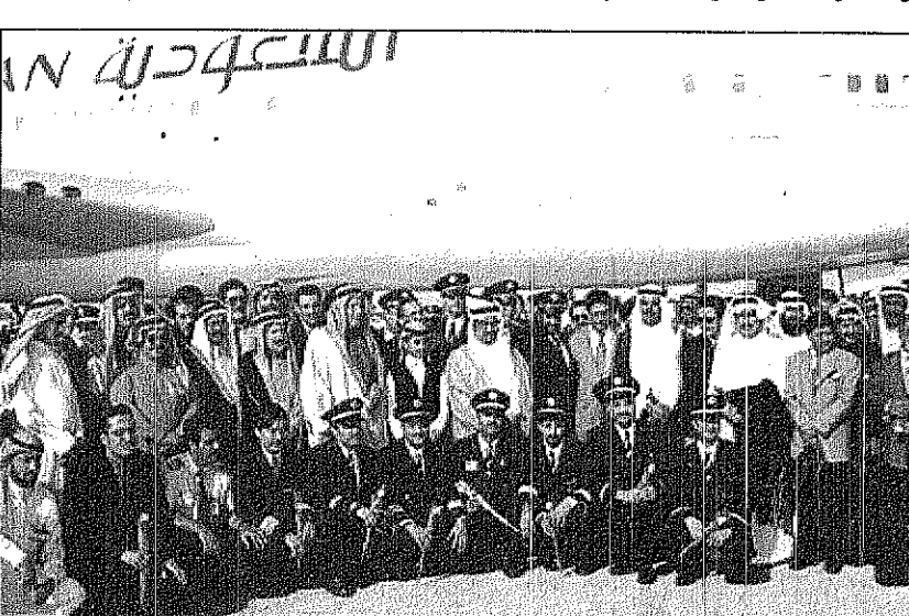
د. بكر يتوسط الملاحين ومسؤولي السعودية لدى وصولهم أمس

عبدالله الحازمي (سيائل - جدة) عبدالرحمن الشهراني الرياض بعد رحلة طيران امتدت حوالي خمس عشرة ساعة من مدينة سيائل شمال غرب الولايات المتحدة الأمريكية حلت في تمام الساعة الثانية والرابع من بعد ظهر أمس بمطار خالد الدولي بالرياض اول طائرة من طلائع اسطول السعودية الجديد وهي من طراز بوينغ 777-300 وعلى متنها معالي مدير عام الخطوط السعودية الدكتور خالد عبدالله بن بكر والوفد المرافق من مسؤولين اسطول السعودية، والاعلاميين والملاحين الذين تم تدريبهم للعمل على الاسطول. وفور وصوله عبر معالي المدير العام للخطوط السعودية بالغ والشكر والعرفان لخادم الحرمين الشريفين سمو ولي عهد الامين وسمو النائب الثاني لما تجده الخطوط السعودية من دعم كبير لتطوير إمكاناتها وخدماتها داخل المملكة وخارجها. وأوضح أن هذا الاسطول يحوي على أحدث الاجهزة التقنية والملاحية والبصرية والسعوية.