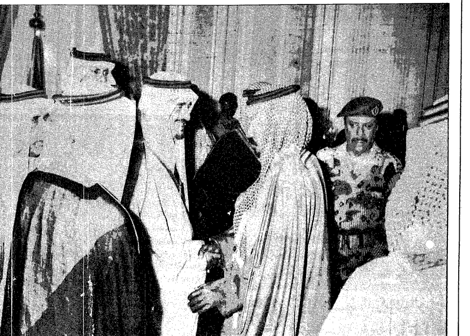
خادم الحرمين الشريفين يستقبل العلماء والمشايخ وجموعا غفيرة من المواطنين

الاعلام المجاورة وعبرا عن سرورها لما شاهدوه من اعمال التوسعة التي نفذت في الحرمين الشريفين إضافة الى الاطلاق والتمثيل الذي تبينه المملكة في كمال المجالات بتوجيه من خادم الحرمين الشريفين . كما شكك احرها فيها من شكرها لخادم الحرمين الشريفين الملك فهد بن عبدالعزيز ال سعود وحكومة المملكة على دعوتهم لزيارتها وزيارة الاسان المقدسة في مكة المكرمة والمدينة المنورة والتي رزعا ولله الحمد بخير وايسر كما ادعت بعض وسائل