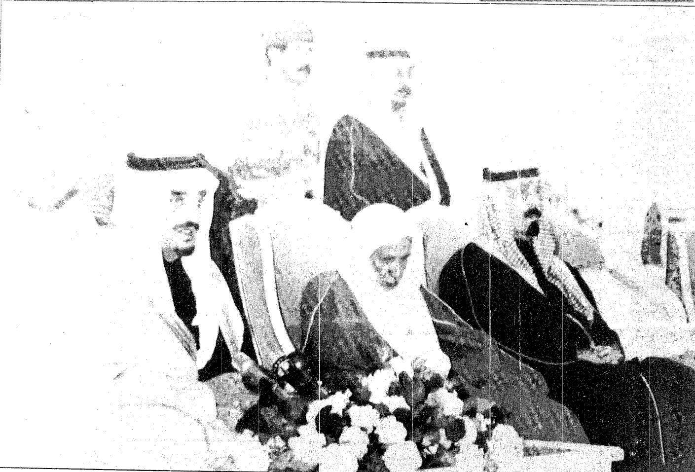
خادم الحرمين الشريفين في حديثه الهام امام العلماء والمشايخ والمواطنين