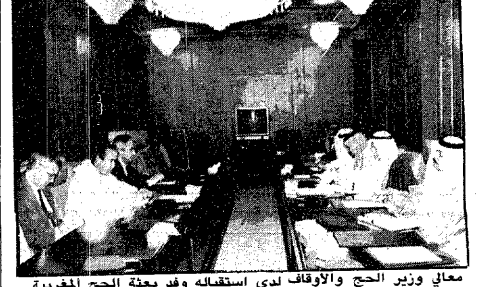
معاي وزير الحج والأوقاف لدى استقباله وفد بعثة الحج المغربية

الاجتماعات واجتماعات اللجنة الفرعية والمنطقة الغربية ووزارة المعارف وغيرها من الجهات الأخرى . وأشار الأستاذ البليان إلى أن اللجان الفرعية المنبثقة عن اللجنة تواصل اجتماعاتها بصفة دائمة لدراسة ومناقشة كافة الموضوعات المتعلقة بشؤون الحج والحجاج وأعداد التقارير الخاصة بذلك . وأكد أن هذا الاجتماع يأتي في إطار اهتمام حكومة خادم الحرمين الشريفين الملك فهد بن عبد العزيز بوضع حج هذا العام منذ وقت مبكر بهدف توفير أفضل الخدمات لحجاج بيت الله الحرام وتحقيق كافة سبل الراحة لهم .