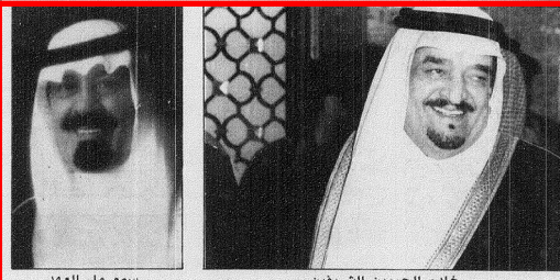
الملك عبد الله بن عبدالعزيز آل سعود في استقبال ضيفه خادم الحرمين الشريفين

حوار السفير القطري محمد الأنصاري: الوحدة الخليجية سبيلنا للتعامل مع التغيرات الدولية عبدالله الربيدي - الرياض: قمة الخليجية ستكون موقرة نظراً للتعهدات التي أبرمتها دول الخليج من اجل وحدة دول مجلس التعاون العربي ووليها بالغة الأهمية حول أهمية هذه القمة والتطلعات بشأن نتائجها لتحشد كافة مساهمة الأستاذ محمد الأنصاري سفير دولة قطر الموقرة لدى بعثته في نظرتهم الى أهمية عقد هذه القمة في شأنها هذا الحدث الهام الذي يعقد في أرض الكويت بعد تحريها وعمدة الامن بها. وهذه التجربة المريرة ودورها وكيفية عدم تكرار ما يشابهها ستكون ما هي ابرز دروس تلك الامة بالنسبة لمسار ومستقبل مسيرة التعاون الخليجي في وقتنا هذا الذي يتطلب التعاون والمشاركة في كل المجالات وان تيسر مبرمجين وخبراء خليجية شاملة.