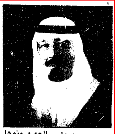
الملك فهد بن عبدالعزيز آل سعود

واس - الرياض : قال سمو ولي العهد نائب رئيس مجلس الوزراء ورئيس الحرس الوطني بما بذله رجال الامن العام من جهود حثيثة لضمان الامن والامن لمواطنيهم على ارض هذا الوطن خلال حرب تحرير الكويت الشقيقة من براثن الظلم والطغيان .. وقال سموه خلال استقباله مكتب سموه في الديوان الملكي بقصر اليمامة بعد ظهر امس كبار قادة وضباط الامن العام الذين قدموا لسموه التهنئة بشهر رمضان المبارك : لقد اديتم واجبتكم على اكل وجهه والخمسة لله ولا تنسى جهود اخواتكم من القوات المسلحة بكافة فروعها واخوانكم في الحرس الوطني .. وقال سموه : لقد شهدت الجبهة الداخلية تلاحما متميزا وفريدا جسد مختلف الشعب السعودي على مختلف الاصعدة ..