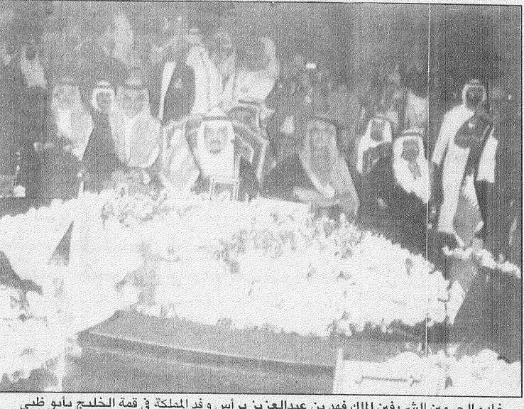
خادم الحرمين الشريفين الملك فهد بن عبدالعزيز يرأس وفد المملكة في قمة الخليج بأبوظبي

القمة بدأت وخادم الحرمين الشريفين في أبوظبي مؤكداً: نتطلع لأصدار ما يدعم نسيجنا الاجتماعي المميز بعد الجلسة الافتتاحية عقد أصحاب الجلالة والسمو أول جلسات مؤتمريهم هذا وأدى القادة الخليجيون في وقت متأخر من مساء أمس أول جلساتهم المغلقة. مزيد من التفاصيل ص ١٠٩-١٠٨