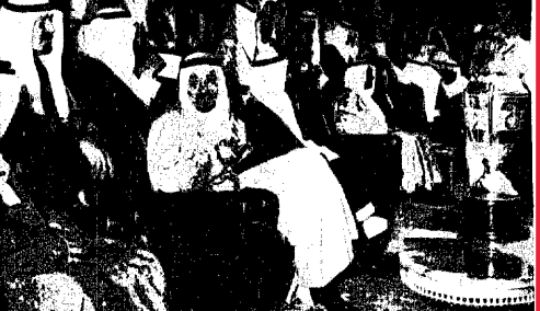
جلالة الملك يرعى حفل سباق الخيل على كاس جلالتيه

لندن - أ ب - اندخلت القوات الأنجولية والكوبية المواقع التي احتلتها القوات جنوب أفريقية في الأسبوع الماضي.