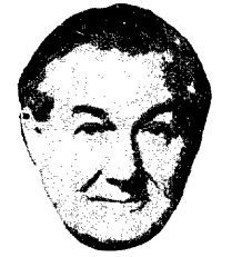
كالاها ن زعيما للحزب ورئيسا لوزراء بريطانيا

عمان - وكالات الأنباء: كشفت الأزمة اللبنانية، عن ضرورة وضع ميشاق جديد للجامعة العربية، بلام مع تطور الأحداث، ويكون عاملاً مؤثراً في تسوية أي خلاف أو صراع بين الدول العربية.