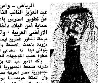
الامير عبد الله

الرياض - واس: تحدث صاحب سمو الملك الأمير عبد الله بن عبد العزيز النائب الثاني لرئيس مجلس الوزراء ورئيس الحرس الوطني عن تطوير الحرس باعتباره قوة مسلحة تحمل مسؤولية المساهمة في حماية أمن البلاد داخلياً وخارجياً والمساهمة في رد الاعتداء عن الأراضي العربية. وأكد سموه على أن الحرس الوطني لابد أن يدخل مرحلة التطور السريع ليصبح قوة سريعة الحركة مزودة بأحدث الأسلحة والتجهيزات وهو لن يتوانى أبداً إذا استدعى إلى الإشتراك في أية خطوة حسب التوجيهات العليا بهذا الشأن.