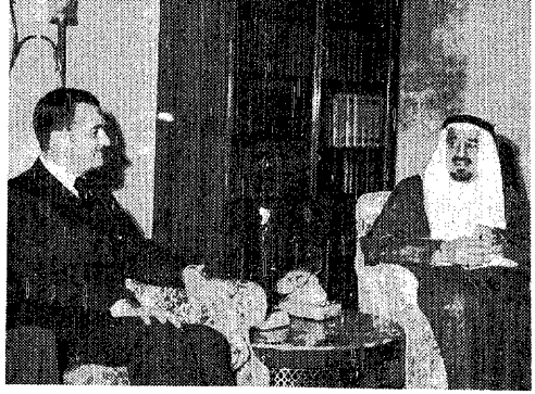
جلالة الملك خالد يستقبل وزير الدفاع الفرنسي

بيروت - وكالات الأنباء: استقبل الرئيس اللبناني إلياس سركيس أمس سعادة الفريق على الشاعر سفير المملكة لدى لبنان وتم خلال المقابلة بحث الخطوات التالية لوصول قوات الردع العربية الى لبنان والتي تشترك فيها القوات السعودية.