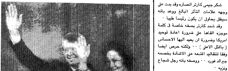
كارتر يرفع يده بالتحية لانصاره هو وزوجته وابنه بعد اعلان نتيجة الانتخابات الأمريكية وفوزه بالرئاسة

وفي عام ١٩٦٦ تقدم كارتر لنسب حاكم ولاية جورجيا ولكنه هزم في الانتخابات التمهيدية ولكن هزيمته لم تمنعه من المحاولة مرة اخرى في عام ١٩٧٠ وقد فاز في هذه المرة وطوال هذه السنوات كان كارتر يعرف على قاعدة الحزب الديمقراطي في سائر أنحاء البلاد من الساحل الشرقي الى ضفاف المحيط الهادي الامر الذي ساعده هذا العام على ترشيح نفسه لنسب الرئاسة منافسا لجيرالد فورد مرشح الحزب الجمهوري ٠٠٠