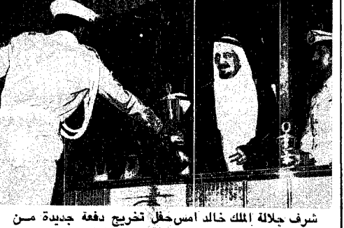
شرف جلالة الملك خالد امس حفل تخريج دفعة جديدة من كلية قوى الامن الداخلي