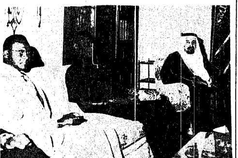
الاجتماع بين جلالة الملك خالد وفخامة رئيس سيراليون

بحر الوقف في القاهرة القاهرة - واف - ذكر راويو القاهرة اليوم ان اسماعيل فهمي وزير الخارجية المصرية اجتمع مع ياسر عرفات الذي وصل الى القاهرة من الجزائر. وقد حضر الاجتماع الفريق اول محمد علي فهمي رئيس اركان حرب القوات المسلحة المصرية. ومجال الصوريان ممثل منظمة التحرير الفلسطينية في القاهرة وسعيد كمال نائب رئيس السدة السياسية للمنظمة ورجحى عوض ممثل منظمة فتح. كما حضر احمد حسن التجارى سفير السودان في القاهرة جزء من هذا الاجتماع الذي استغرق ثلاث ساعات ونصف الساعة. مصدر سوري رسمي ينفي توقيع اتفاقات جديدة دمشق - وكالات الأنباء - نفى مصدر سوري رسمي ان بلاده قامت بتوقيع اتفاقات جديدة بشأن وقف القتال. وكان يقصد بذلك الاتية التي ازيعت من القاهرة امس منسوبة الى مصادر منظمة فتح. وقال المصدر السوري ان كل ما حدث هو ان سوريا وافقت على مبدأ وقف إطلاق النار غير انه لا يتم التوصل بعد. الى صيغة نهائية مثل هذا الاتفاق. وأضاف المصدر السوري الرسمي قائلا ان التصريح الذي نشرته على أنباء «صحف» اتفاق «من المصدر اخلاق ومضى قائلا ان المحرر ما زال مفترا لمناقشة مشروع اتفاق لوقف إطلاق النار. وأشار الى ان عبد السلام جلود يقوم بمحاولات للتوصل الى مثل هذا الاتفاق. متحذرا من انه قد يفتن بعض السوريين بهذه المفاوضات. رئيس الوزراء الليبي يسافر الى بيروت بيروت - وكالات الأنباء - ومسئل الى بيروت. قادما من دمشق. بعد السلام جلود رئيس الوزراء الليبي. وذلك على اثر الاهتمامات التي وجدها الفلسطينيون الى سوريا بمعاينة مواقعها فوق قم جبل لبنان.