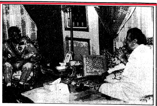
الرائد والوفد... يتلقيان توجيهاً من الأمير محمد بن عبد العزيز

حدثنا الأمير صاحب السمو الملكي الأمير محمد بن عبد العزيز في عمل المستقبل رائد الفضاء العربي المسلم سمو الأمير سلطان بن سلمان بن عبد العزيز، وزميله العملاق المقدم رائد العربى المسلم... تهنئة ودعوات صادقة للتوفيق، وتوجيهات مخلصه.