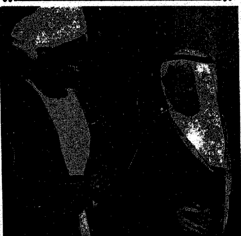
سعادة وكيل وزارة الخارجية الشيخ إبراهيم السليمان مع سعادة السفير السوداني في حفل وداع السفير بمناسبة انتهاء خدماته في السعودية

تود وزارة الداخلية أن تسدرك المواطنين بما سبق أن اعلنته من ترتيبات بشأن أوضاع الاسمنت أن تؤكد للجميع تجاراً ومستهلكين بأن حكومة جلالة الملك عازمة على متابعة تزايد ما فرته بهذا الشأن بكل حزم وأن تعاون المواطنين شرط أساسي لنجاح خطتها في سبيل القضاء على أسباب المشكلة كما تود أن تشير إلى ما سبق أن اعلنته من دعم للمواطنين بإبلاغها عن أي تصرفات تخالف الاسعار المعلنه مقابل جوائز