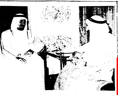
جلالة الملك خالد يستقبل سمو الشيخ صقر بن محمد القاسمي حاكم رأس الخيمة عند وصوله امس

وقد رأس الحبيب اللبناني في هذا الاجتماع الرئيس المنتخب الياس كركس ورئيس الجانب السوري نائب وزير الدفاع وقائد القوات الجوية اللواء ناجي جيسل ورئيس الجانب الفلسطيني رئيس منظمة التحرير الفلسطينية السيد ياسر عرفات وحضر الاجتماع ميمون جامعة الدول العربية الى لبنان الدكتور حسن صديري الخولي . وقد استعملت مدعية الهاون في القتال على طول الخط الفاصل بين القطاعين الشرقي والغربي من بيروت بينما ظل القصف الضوئي للمناطق السكنية مستمرا - كما جرت استبيانات بالمدعية وصدامت في الضواحي الجنوبية في عين الرمانة والساحل وساحة السمان المحيطة الى منطقة الحدت وكثر شيئا استخدمت فيها المدفعاات الثقيلة .