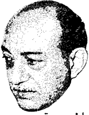
رياض يجتمع بالسفراء العرب بلندن

ولمقا للمعلومات التي اذاعتها دوائر المؤتمر فان لجنة الطاقة قد ناقشت اقتراحا امريكيا بانشاء معهد طاقة دولي لدراسة احتياجات الطاقة في الدول النامية وتدريب الفنيين واستكشاف وتنمية مصادر الطاقة وتنظيم المساعدات التكنولوجية للدول النامية . وقد درست لجنة التنمية والمال مشكلات الديون الكبيرة للدول النامية . ورفضت الدول الصناعية مطلب دول العالم الثالث بالتأجيل الفوري لتسديد الديون للدول النامية الاشد فقرا .