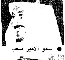
سمو الأمير متعب