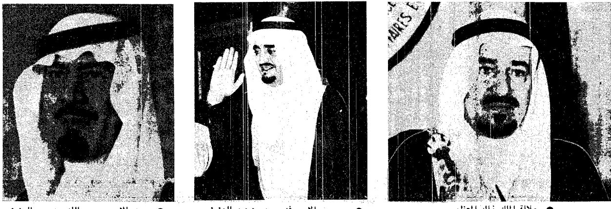
جلالة الملك خالد المعظم • سمو الأمير فهد بن عبد العزيز • سمو الأمير عبد الله بن عبد العزيز

صدر أمر ملكي كريم باعادة تشكيل الوزارة ٠٠ ضم التشكيل الوزاري الجديد اثنين وعشرين وزيرا من بينهم سبعة من مديري وأساتذة وعمداء الكليات الجامعية ٠٠ ودخل الوزارة لأول مرة اثني عشر وزيرا ٠٠ كما استحدثت وزارات جديدة ٠٠ وثلاثة وزراء دولة ٠٠ وبمناسبة التشكيل الوزاري الجديد وجه جلالة الملك خالد بن عبد العزيز الكلمة السامية التالية :