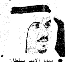
سمو الأمير سلطان