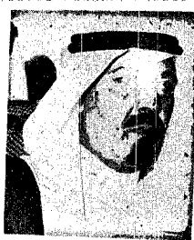
عبدالله بن عبد العزيز عبدالله بن عبد العزيز عبدالله بن عبد العزيز

كما سيقوم سموه بزيارة إمارة (التمال) خلال جولته التي تستمر ثلاثة أيام وهو مهتم بالجولة التفقدية الراحة سموه حيث كان سموه قد قام بجولة على منطقة الجنوب في أيام المعاشي استمرتها خمسة عشر يوماً بالإضافة إلى جولتين تمت خلال هذا العام وذلك في نطاق مخطط الإمارة للعمل على تطوير المناطق التابعة لها والاتصال على أحفادها لمسايرة نهضة المنطقة الشاملة التي تعيها المملكة تحت رعاية جلالة الملك المفدى.