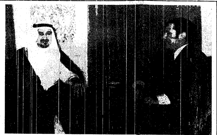
جلالة الملك العظيم يستقبل معالي السيد عبد السلام حاتم

وقال حاتم ان الرئيس السادات قد وافق على وقف إطلاق النار بين مصر وسوريا في إطار اتفاقية الفصل الجديدة.