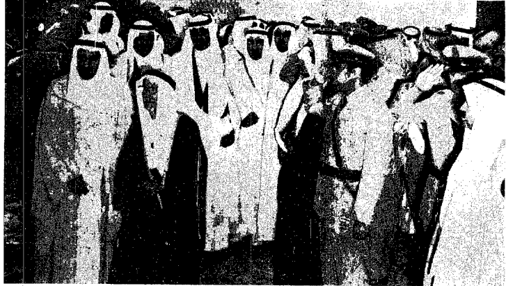
جلالة الملك خالد العظيم يهنئ بمفارقة صلى العيد الكبير بمدينة الطائف بعد اذنه وعدد من اصحاب السمو الامراء صلاة عيد الفطر المبارك

● واشنطن - ديا - توقع امس السيد ياسر عرفات رئيس اللجنة التنفيذية منظمة التحرير الفلسطينية قيام « حرب طويلة وصعبة » اذا استمرت اسرائيل في رفض قيام دولة فلسطينية مستقلة