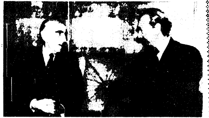
الامر المتحدة - كورت فالدهايم السكرتير العام للأمم المتحدة يستقبل فيليب تولا وزير خارجية لبنان . ( لاسلكية يب )