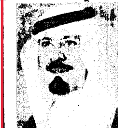
سمو الامير عبد الله بن عبدالعزيز وزير الدفاع والطيران والمفتش العام

الوكيل حسين بكرى قزاز مكة / جدة الرياض / الخبر