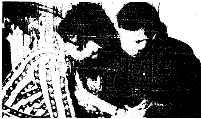
ماينلا اشهر قارئة كفي اللطيفين تقرا الكف لبطال العالم محمد على كلال وقد تحقق كل ما قائلته عن فوزه بالمباراة التي خاضها ضد فريز اخيرا .