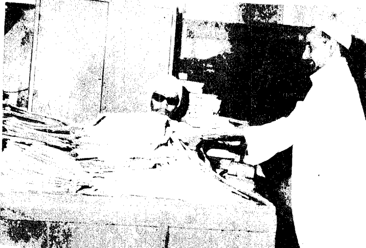
الصورة لا تحتاج الى تعليق : الاف الاوراق امام موظف واحد والتعليق : تعطل مصالح المواطنين قد تصل الى اسابيع

الجوازات مرفق هام من المرافق الحيوية التي يتردد عليها المواطن يوميا وكذلك يتقدم عليها الاخوة العرب والاجانب .. انها الصورة الاولى لواجهة اي بلد يواجهها القادم من اي بلد كان .. وتتنظر نظرة داخلية لجوازات جسد لتزرى وتسمع ماذا يقوله المواطن ويقول السائح ..