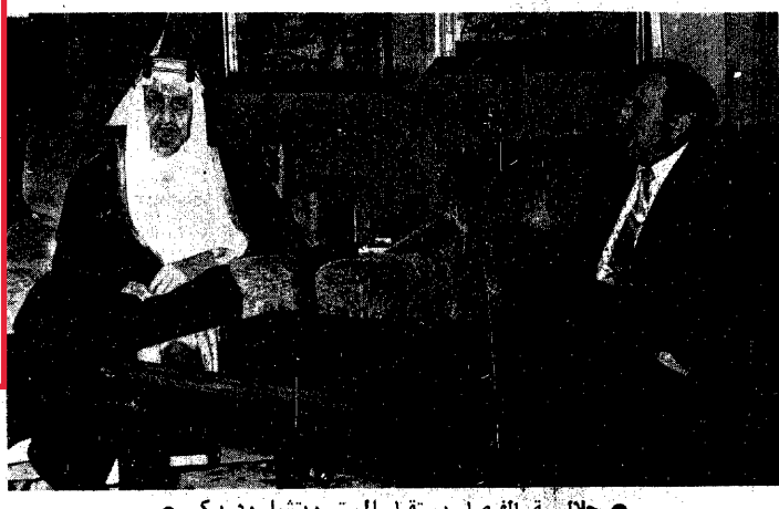
جلالة الفيصل يستقبل المستر ريتشارد بيكر

جهدلة الفيصل يشرف الحفل السنوي لنادي الفروسية بالرياض يوم ١٨ من الشهر الحالي الرياض - وكالة الانباء السعودية: سيعام تحت رعاية صاحب اجلالة الملك فيصل المفدى الحفل السنوي لنادي الفروسية يوم الاثنين ١٨ ربيع الاول عام ١٣٩٢ هـ وقال صاحب السمو الملكي الامير عبدالله بن عبد العزيز رئيس الحرس الوطني ورئيس نادي الفروسية الذي اعلن ذلك لوكالة الانباء السعودية انه سيكون السباق على كأس جلالة وبن جهة اخرى صرح الاستاذ عبدالله البسام مدير النادي بأنه مسن المتوقع ان تشترك بعض دول الخليج في هذا السباق العام