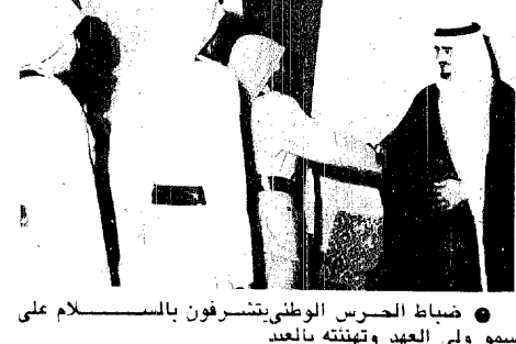
ضباط الحرس الوطنى يتشرفون بالسلام على سمو ولى العهد وتهنئته بعيد الأضحى المبارك .