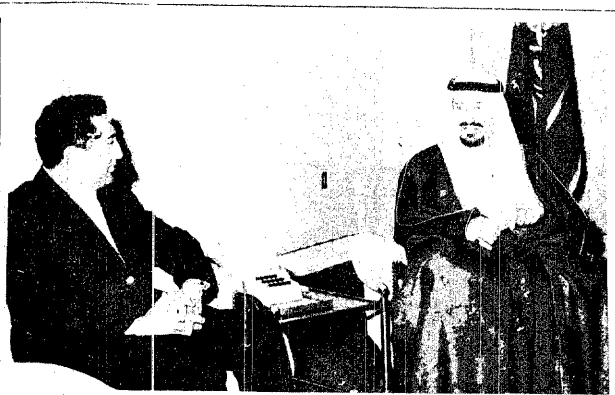
جلالة الملك يجتمع بالبريس المحمدي قبل مغادرته جدة

استقبل جلالة الملك خالد بن عبد العزيز في مكتبه بقصر الرئاسة في الساعة العاشرة والنصف من صباح امس فخامته المقيم ابراهيم الحمدي رئيس مجلس القيادة والجمهورية العربية المعنية والوفد المرافق لفخامته حضر المقابلة صاحب السمو الملكي الامير فهد بن عبد العزيز وولي العهد ونايب رئيس مجلس الوزراء الدولي صباح امس وكان في وداعه بالمطار صاحب البقية من ٤ -