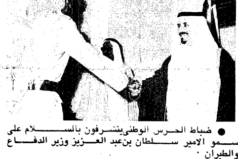
ضباط الحرس الوطنى يتشرفون بالسلام على سمو الامير سلطان بن عبد العزيز وزير الدفاع والطيران .