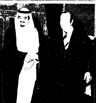
سمو الامير فهد يرحب بالسيد زيد الرفاعي رئيس وزراء الاردن

جدة - واس - قام دولة السيد زيد الرفاعي رئيس وزراء الاردن بزيارة قصيرة للمملكة استقبله خلالها جلالة الملك خالد بن عبد العزيز وصاحب السمو الملكي الامير فهد بن عبد العزيز وولي العهد ونايب رئيس مجلس الوزراء بالديوان الملكي بعد ظهر امس وكان دولة السيد زيد الرفاعي رئيس وزراء الاردن والوفد المرافق له قد وصل مطار جدة صباح امس وكان في استقباله في المطار صاحب السمو الملكي الامير عبد الله بن عبدالعزيز النائب الثاني للسفارة لدى مجلس الوزراء ورئيس المحسوس الوطني وصاحب السمو الملكي الامير فواز بن عبد العزيز امير منطقة مكة المكرمة وعدد من اصحاب المجالس الوزراء وسماحة الشيخ محمد الامين الشنقيطي سفير الاردن لدى البقية من ٦ -