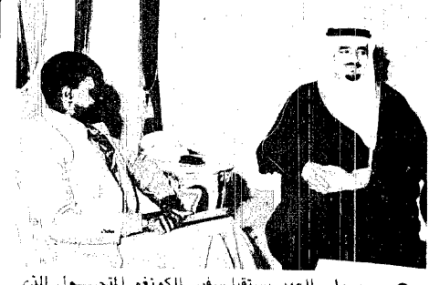
سمو ولى العهد يستقبل سفير الكونغو المتجول الذى حمل اليه رسالة من رئيس وزراء الكونغو .