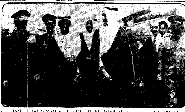
جلالة الملك خالد يصحب ضيفه العامل الإيراني الكبير الى صلاة الاستراحة في المطار الثاني لوزير مجلس الوزراء ورئيس الحرس الوطني.

جدة - واس - استقبل معالي الشيخ محمد ابراهيم مسعود وكيل وزارة الخارجية في خبته ظهر امس سفراء الهند والصين والملكة الاردنية الهاشمية المعتمدين لدى المملكة.