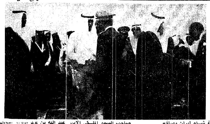
صاحب السمو الملكي الامير عبد الله بن عبد العزيز يصحب جلالة الملك خالد في صلاة الاستراحة في المطار الثاني لوزير مجلس الوزراء ورئيس الحرس الوطني.