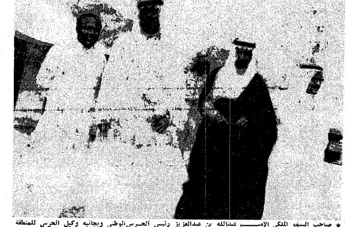
صاحب السمو الملكي الامير عبدالعزیز بن عبد العزيز رئيس الحرس الوطني وبجانبه وكيل الحرس للمنطقة الغربية الشيخ محمد العتيان