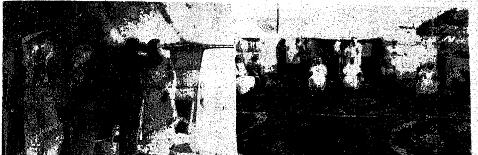
تمثل الصورة صاحب السمو الملكي الأمير عبدالعزيز بن عبد العزيز رئيس الحرس الوطني وحوله بعض اصحاب السمو الملكي الامراء في منى ثم سموه وهو يستقبل فيسائط الحرس الوطني الذي جاوا لتهنئته بعد الاصحى المبارك .. وكذلك تمثل لصورة بعض جنود الحرس الوطني وهم يقومون بتنظيم المرور امام معسكر الحرس .. واخيرا بعض افراد الحرس يرشدون الحجاج التائهين