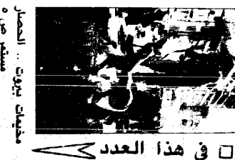
في هذا العدد

أبوجهاد ووصل ألبعثمان - وكانت الأزمات - عمان - أكد السيد علي البزور، وزير العدل، أن اتفاق التوافق الوطني الفلسطينية أصبح العمل الأردني الفلسطيني منتهيا لتسوية القضية الفلسطينية. وقال البزور، في بيان له عقب توقيع الاتفاق، إن هذا الاتفاق يفتح آفاقا جديدة للتعاون بين الجانبين الفلسطيني والأردني، ويؤكد على أهمية العلاقات الثنائية بين البلدين، خاصة في المجالات الاقتصادية والاجتماعية والثقافية. وأضاف البزور، إن هذا الاتفاق يفتح آفاقا جديدة للتعاون بين الجانبين الفلسطيني والأردني، ويؤكد على أهمية العلاقات الثنائية بين البلدين، خاصة في المجالات الاقتصادية والاجتماعية والثقافية.