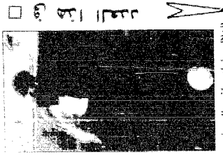
الرجال ولياه واجه الصبي اللقاع الحليص من ١٦

تأكيد احتطاف فانوون من روما ١ ف ب - روما أكدت لجنة التحقيق الدولية البريطانية ان رافعا يحمل اسم بوروجداي فانوون كان ضمن قائمة ركاب الطائرة التي حطت في ايطاليا، وروما يوم ٢٠ سبتمبر الماضي، مما يؤكد ان هلاك الطائرة التي تحطت في روما التي يتكلمون التحقيق في القضية ان فانوون كان يحتم العودة للندن مرة أخرى إلا ان الايطاليين يتكلمون التحقيق في القضية ان فانوون كان يحتم هلاكه فانوون لم ينجح في الهبوط في روما كما كان الاعتقاد سابقا في ظل الواسطه التي حلت الامراض الجوية الايطالية البريطانية حول الامراض الجوية الايطالية ويتكلمون التحقيق نتائج التحقيقات الايطالية مع حيث من الترقب ان يتم سجنه لمدة لا تقل عن ٤٥ عاما .