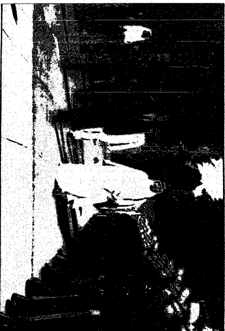
سمو الأمير عبدالله والأمير جوان كارولوس عامل استقبالي في زيارة سابقة لسموه لأميرة

هذا يدل سمو - ان المراجعة تعلقه هناك بالنسبة لزيارات هذه الامة - ولكن مثل انيا منطقة الازارنا حرمياتا ان مثل هذه المراجعة والنسبة