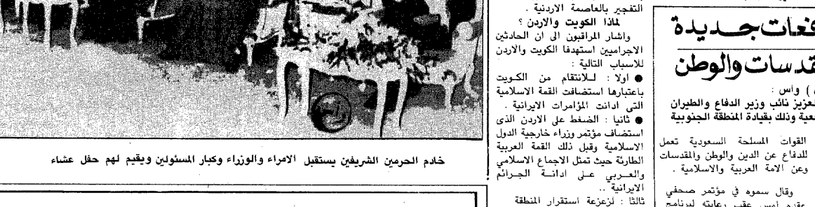
خادم الحرمين الشريفين يستقبل الامراء والوزراء وكبار المسؤولين ويقدم لهم حفل عشاء

سمو الأمير عبد الله في مقدمة مستقبلي الملك فهد بجائل بعثة عكاظ - صالح الفهد - حائل ، واس : استقبل خادم الحرمين الشريفين الملك فهد بن عبدالعزيز آل سعود - حفظه الله - في الديوان الملكي بقصر اجا مساء امس المسؤولين سمو الامراء واصحاب المعالي الوزراء وكبار وحضر الاستقبال صاحب السمو الملكي الامير عبدالله بن عبدالعزيز ولي العهد ونائب رئيس مجلس الوزراء ورئيس الحرس الوطني . وقد تناول الجميع طعام العشاء على مائدة خادم الحرمين الشريفين وكان خادم الحرمين قد وصل الى حائل الساعة السادسة والرابع من مساء امس في اطار الجولات التفقدية التي يقوم بها - حفظه الله - لمناطق المملكة وكان في مقدمة مستقبليه بمطار حائل الاقليمي سمو ولي العهد وكان سمو الامير عبدالله بن عبدالعزيز قد وصل امس الى حائل قادما من الرياض ليكون في مقدمة مستقبلي خادم الحرمين الشريفين . وستفضل خادم الحرمين الشريفين خلال جولته في منطقة حائل بافتتاح مشروع كهولاء حائل المركزي والذي بلغت تكلفته الاجمالية الف مليون ريال ويعدى بالكهولاء اكثر من ٣٠٠ مدينة وقرية اضافة الى مدينة حائل . واكد صاحب السمو الملكي الامير مقرن بن عبدالعزيز امير منطقة حائل في تصريح له - عكاظ - ان المنطقة بأسرها ترحب بخادم الحرمين الشريفين وسمو ولي عهده الامين . ومن جهة ثانية وصف وكيل امارة منطقة حائل حمد راشد ابو نيان في تصريح لوكالة الانباء السعودية زيارة خادم الحرمين الشريفين لمنطقة حائل بانها تجسيد للمحبة والراة الذين يربطان بين القائد وابناء شعبه . [ التفاصيل ص ٥ ]