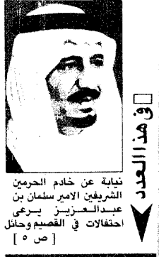
في هذا العدد

تباينة عن خادم الحرمين الشريفين الأمير سلطان بن عبدالعزيز - سيرة يبري احفالات في القصيم وحائل [ ص ٥ ]