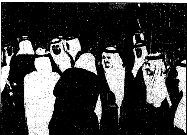
خدام الحرمين الشريفين لدى وصوله الى مطار حائل