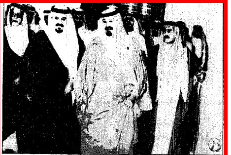
سمو في العهد لدى مغادرتهم الرياض متوجها الى حائل

صالح الفهد - سليمان السديهي - واس (حائل) : وصل خادم الحرمين الشريفين الملك فهد بن عبدالعزيز الى حائل الساعة السادسة والربع من مساء امس في مطار حائل. وكان في استقبال خادم الحرمين الشريفين في مطار حائل الاقليمي صاحب السمو الملكي الامير عبدالله بن عبدالعزيز ولي العهد ونائب رئيس مجلس الوزراء وصاحب السمو الملكي الامير سلطان بن عبدالعزيز أمير منطقة الرياض وصاحب السمو الملكي الامير مقرن بن عبدالعزيز أمير منطقة حائل واصحاب السمو الملكي الامراء واصحاب الفضيلة العلماء والمسؤولين من مدينتي وعسكريين. وعند سلم الطائرة قدم مجموعة من الاطفال باقات من الورد لخدام الحرمين الشريفين بعد ذلك عزف السلام الملكي. ثم توجه خادم الحرمين الشريفين الى الصالة الملكية وصافح كبار مستقبليه من مدينتي وعسكريين وجوعا من المواطنين.