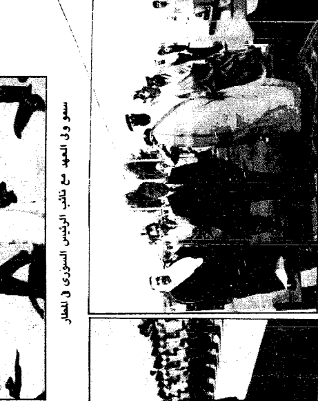
سمو الأمير عبدالله والسيد خدام عرفوا المسلمين الوطنيين لمنطقة وسوريا