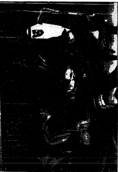
خدام الحرمين الشريفين يستقبلون وزير خارجية فرنسا