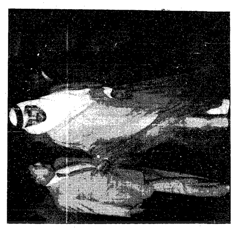
الامير سعود الفيصل يستقبل ويكرم باطرا

ويؤكد المجلس تأييده التام للمملكة الكوالم العربية السعودية وللصحة والسلامة التي قام بها الشطب واللقنة التي قام بها الاربعة والخمسين في موسم الحج والعمرة لخدمة الايمن القديسة اتخذتها حكومة الامارات التي اجراءاتها لخدمة الحرام من اجل تأدية لواجبها بين الله بيت الله ومطامير المسلمين . كما ايدت القرارات التي اتخذتها على حدة بين الله ووقف مؤيدا للمملكة العربية السعودية في اجراءاتها التي اتخذتها لحفظ أمنها واستقرارها في ظل السلم الداخلي والتعاون المتبادل بين دول مجلس التعاون الاسلامي .