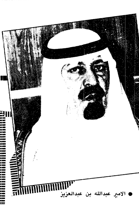
الأمير عبدالله بن عبدالعزيز

الحرس الوطني للتفتيش الفنية عضواً وسعادة عميد شؤون المكتبات بجامعة الإمام محمد بن سعود الإسلامية عضواً وسعادة عميد شؤون المكتبات بجامعة الملك سعود عضواً وسعادة الأستاذ فيصل بن عبدالرحمن المعمر مدير مكتبة الملك عبدالعزيز العامة اختياراً كما تم تكوين لجنة علمية للمكتبة تقوم بمهمة اختيار وتحديد مصادر المعرفة المناسبة للمكتبة وتقديم الاستشارات للنشاطات الثقافية التي تمارسها المكتبة كما أن المكتبة تستعين بإسناد متخصصين في شؤون المكتبات وذلك للمساهمة في استمرار تقدم المكتبة.