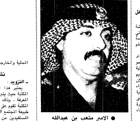
الأمير متعب بن عبدالله

فتحات صباحية وسائية لرواد المكتبة المطبخية والخارجية فيما يحقق أهداف المكتبة . نشأت المكتبة - التزويد : يعتبر هذا القسم من أهم وأبرز أقسام المكتبة حيث يتم من خلاله اختيار وتأمين أوعية المعرفة ، وذلك وفق سياسة شراعية وضعتها المكتبة تقوم بمراعاة طبيعة المكتبة ، ومن ثم طبيعة المجتمع الذي تخدمه ، وبالتالي مستويات المستفيدين من المكتبة . ويقوم قسم التزويد باستمارة بأسوات الاختيار من قوائم ويبيوغرافيات وأدلة وفهارس الناشرين بالمهام التالية : - اختيار المواد المناسبة وطلبها من مصادرها مباشرة . - تلقي الكتب المطلوبة سواء كانت على مسيل بالأضافة إلى محتويات المكتبة من دوريات ومواد لتسهيل تهيئتها لفهرستها وتصنيفها . - في مجال الفهرسة يستخدم التقنيين الدولي للوصف البيبليوغرافي ، أما التنظيم الموضوعي فيتم وفق تصنيف ديوي العشري في طبيعته العربية المعدلة لفرانسيس اسماعيل ، وتستخدم في الفهرسة الموضوعية قائمة رؤوس الموضوعات التي أصدرتها عمادة شؤون المكتبات بجامعة الملك سعود . ويوجد هذه الأسس تم تكوين فروع يطابقها يمثل كل مقتنيات المكتبة حسب التقسيم التالي : - فهرس المؤلف : رتب هجائياً حسب عناوين الكتب والأوعية الأخرى . - فهرس الموضوع : يهدف إلى مساعدة الباحثين في التعرف على الموضوعات التي تعالجها مقتنيات المكتبة وذلك وفق رؤوس الموضوعات ، وقد رتب هجائياً . - الفهرس التصنيفي : جمعت فيه البطاقات في ترتيب تسلسلي حسب أرقام التصنيف التي تحدد موقع المادة في الرف . المكتبة من الكتب والمخطوطات والنوادر والمطبوعات الحكومية والوسائل السمعية والبصرية .