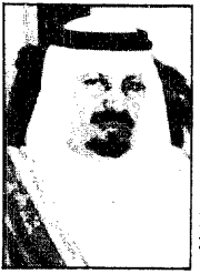
الأمير عبدالرحمن سموه ل. عكاظ . صهيونية لا تقبل أي تهديدات