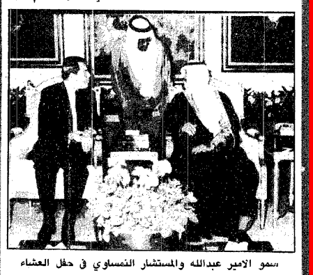
سمو الأمير عبدالله والمستشار النمساوي في حفل العشاء

عبدالله العريفيج « الرياض » واس : أقام صاحب السمو الملكي الأمير عبدالله بن عبدالعزيز ولي العهد ونائب رئيس مجلس الوزراء ورئيس الخرس الوطني مساء أمس حفل عشاء تكريماً لدولة المستشار الاتحادي لجمهورية النمسا الدكتور فرانس فرانتسكي . وحضر الحفل عدد من اصحاب السمو الملكي الامراء ونباتي الوزراء وكبار المسؤولين من مدنيين وعسكريين واعضاء الوفد المرافق للمستشار النمساوي . وكان المستشار النمساوي قد وصل الى الرياض في وقت سابق أمس حيث كان سمو الأمير عبدالله في مقدمة مستقبلي دولته بالمطار . [ تفاصيل ص ٥ ]