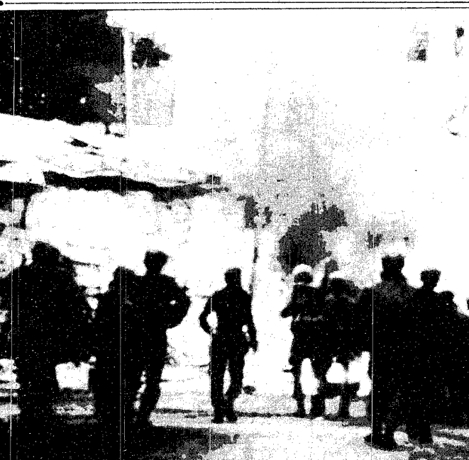
اطلاق النار وقنابل الغازات السامة وتكسير ايادي وأرجل الفلسطينيين. اسلحة جريها العدو الصهيوني لنقم الانتفاضة الفلسطينية شهدت الأراضي المحتلة اعنف المصادمات

○ العراق يقصف أكبر مصفاة نفط تمول الجيش الإيراني ○ استراتيجية عسكرية بين القاهرة وبغداد