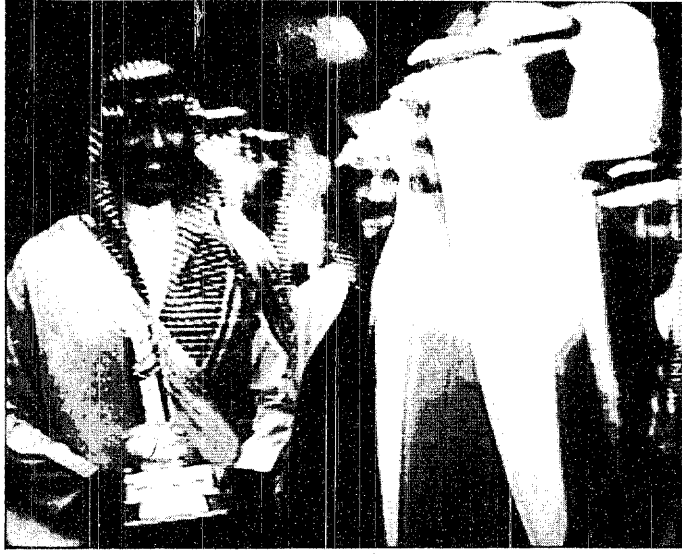
الأمير عبدالله بن عبدالعزيز بعد تسليمه الكأس للأمير متعب بن عبدالله صاحب الجواد الفائز

مقر الحفل مودعا بمثل ما استقبل به من حفاوة وتكريم . وعقب نهاية السباق تحدث الأمير متعب بن عبدالله بن عبدالعزيز مع سربه الأمير عبدالله بن عبدالعزيز صاحب الجواد بكأسه وأكد ان السباق كان قويا ومثيرا وشارك فيه مجموعة من أفضل الجياد . وأوضح سموه انه كان يتوقع فوز « بكأس سمو ولي العهد لما يتفتح به الجواد من مستوى جيد .