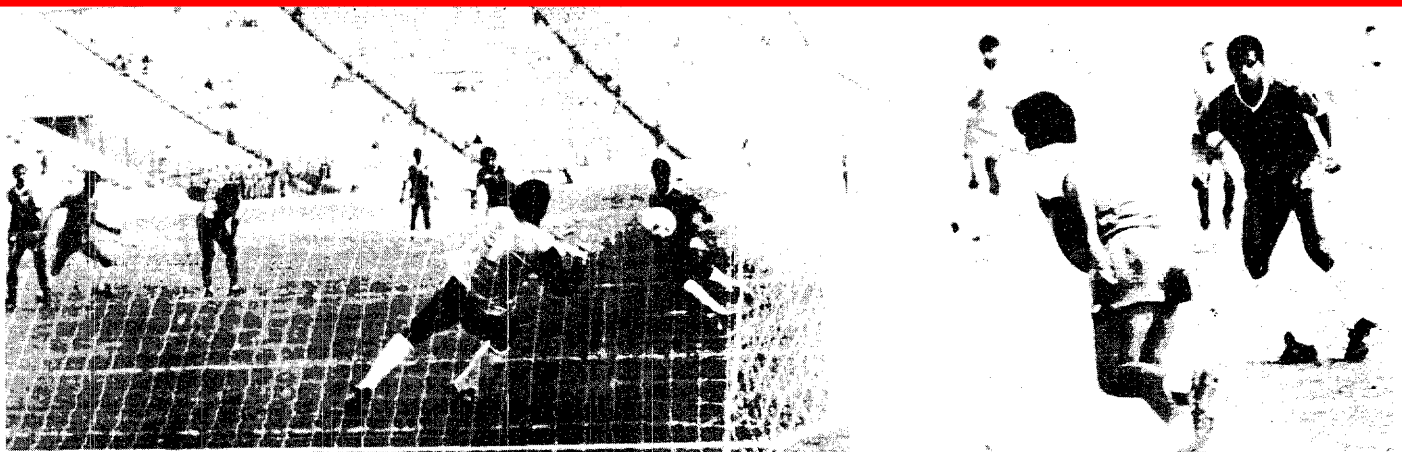
يوسف عبدي كان موفقا كعادته وصد ضربة الجزاء

واس - بيروت : نوهت صحيفة لبنانية باسناد الملك فهد الدولي الرياضي الذي بعد انجازا رياضيا كبيرا اكتمل مع بداية دورة كأس الخليج العربي التاسعة لكرة القدم . واكدت « صحيفة اللواء » في عددها الصادر أمس ان الاستاد الذي اطلق عليه اسم « استاد الملك فهد الدولي » يعد واحدا من افضل المنشآت الرياضية في العالم معماريا وهندسيا .. وقالت ان الاستاد الجديد الذي تقدمه المملكة لتشييده جاء بدعم من خادم الحرمين الشريفين الملك فهد بن عبدالعزيز وسمو ولي عهده الأمين للقطاعات المختلفة ومنها قطاع الشباب الذي يحظى باهتمامها الكبير اذ استطاع صاحب السمو الملكي الأمير فيصل بن فهد بن عبدالعزيز الرئيس العام لرعاية الشباب ان يعمل على اقامة هذا الصرح الرياضي الكبير الذي اعتبر اول هدية رياضية في العام الجاري لشباب الملكة والخليج ..