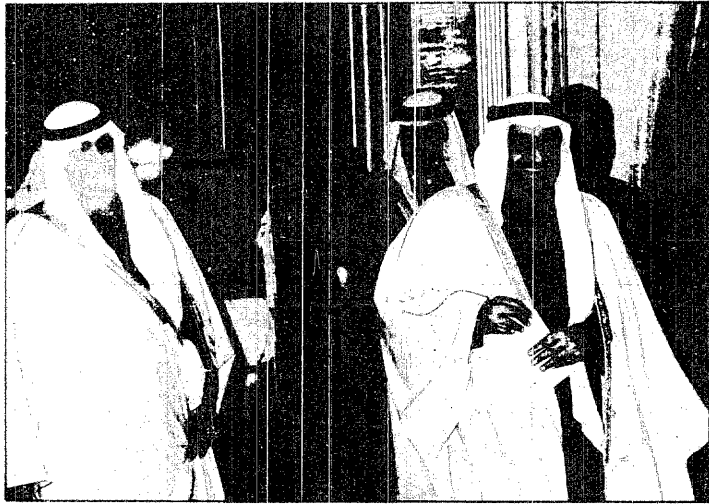
خادم الحرمين، وسمو ولي العهد.. حماية الصناعة بشرط

توجيهات خادم الحرمين تركز الشقة بالمنهج الوطني وتدعم صناعتنا الوطنية الجودة والسعر المعقول لصلحة البائع والمستهلك